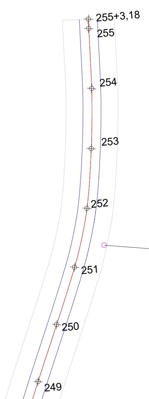
PROJETO GEOMÉTRICO - ENTRE AS E 249 - E255+3,18 ESCALA 1:750