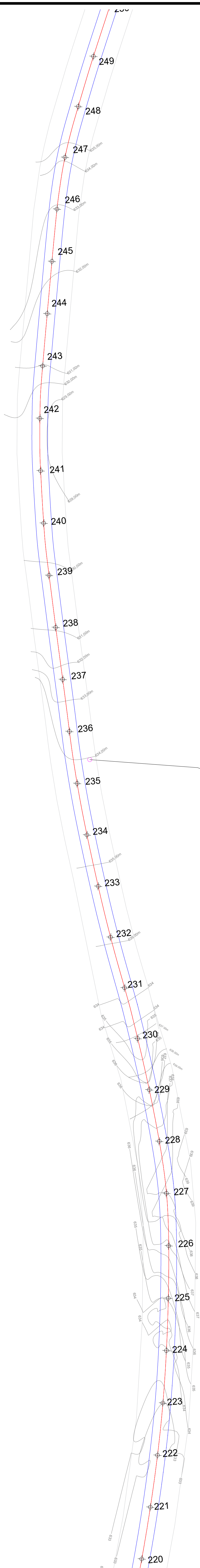
PROJETO GEOMÉTRICO - ENTRE AS E220 - E 249 ESCALA 1:750